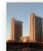
New Milan Offices