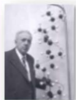
1963 Giulio Natta Nobel Prize for chemistry